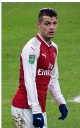
Ο ΓΚΡΑΝΙΤ ΤΣΑΚΑ

ΠΟΙΟΥΣ ΠΑΙΚΤΕΣ ΝΑ ΠΡΟΣΕΞΕΤΕ: Ξεχωρίζουν ο σπουδαίος μέσος Γκρανίτ Τσάκα της Άρσεναλ, ο πολύ καλός επιθετικός της Μπενφίκα Χάρις Σεφέροβιτς , όπως και ο πάντα υπολογίσιμος τεχνίτης χαφ Σερντάν Σακίρι.