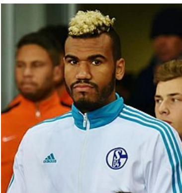
Ο ΕΡΙΚ ΤΣΟΥΠΟ ΜΟΤΙΝΓΚ

ΠΟΙΟΥΣ ΠΑΙΚΤΕΣ ΝΑ ΠΡΟΣΕΞΕΤΕ: Πρώτα φυσικά τον ηγέτη της Τσούπο-Μότινγκ που στη Μπάγερν σκοράρει με ευκολία, ενώ πολύ καλός είναι και ο αμυντικός μέσος Ανγκισά της Νάπολι και το ίδιο και ο επιθετικός της Λιόν Τόκο Ενκαμπί.