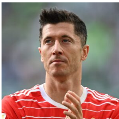
Ο ΡΟΜΠΕΡΤ ΛΕΒΑΝΤΟΦΣΚΙ

ΠΟΙΟΣ ΠΑΙΚΤΕΣ ΝΑ ΠΡΟΣΕΞΕΤΕ: Πρώτα απ'όλους φυσικά τον ηγέτη της Ρόμπερτ Λεβαντόφσκι που στα 35 του κάνει "παπάδες" στη Μπαρτσελόνα, αλλά βέβαια και τον εξαιρετικό παρτενέρ του στην επίθεση Αρκάντιους Μίλικ της Γιουβέντους. Επίσης και ο ποιοτικός χαφ Ζιελίνσκι της Νάπολι αξίζει την προσοχή μας.