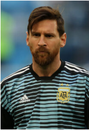
Ο ΛΙΟΝΕΛ ΜΕΣΙ

ΕΚΤΙΜΗΣΗ: Για πολλούς θεωρείται το φαβορί για την κατάκτηση του τροπαίου και σίγουρα είναι καλή ομάδα και έχει τις δυνατότητες να το κάνει, αν και υπάρχουν ενστάσεις και για την κατάσταση του πάντα κομβικού 37χρονου Μέσι και για την ποιότητα της αμυντικής γραμμής της.