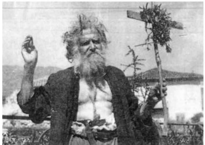
ΧΑΡΑΛΑΜΠΗΣ: Η ΠΙΟ ΑΙΝΙΓΜΑΤΙΚΗ ΠΡΟΣΩΠΙΚΟΤΗΤΑ ΤΗΣ ΕΠΟΧΗΣ