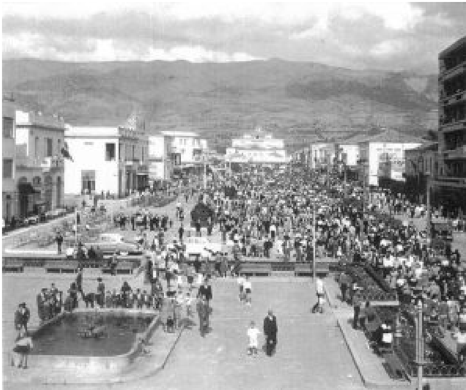
ΚΕΝΤΡΙΚΗ ΠΛΑΤΕΙΑ (ΨΑΡΑΚΙΑ)