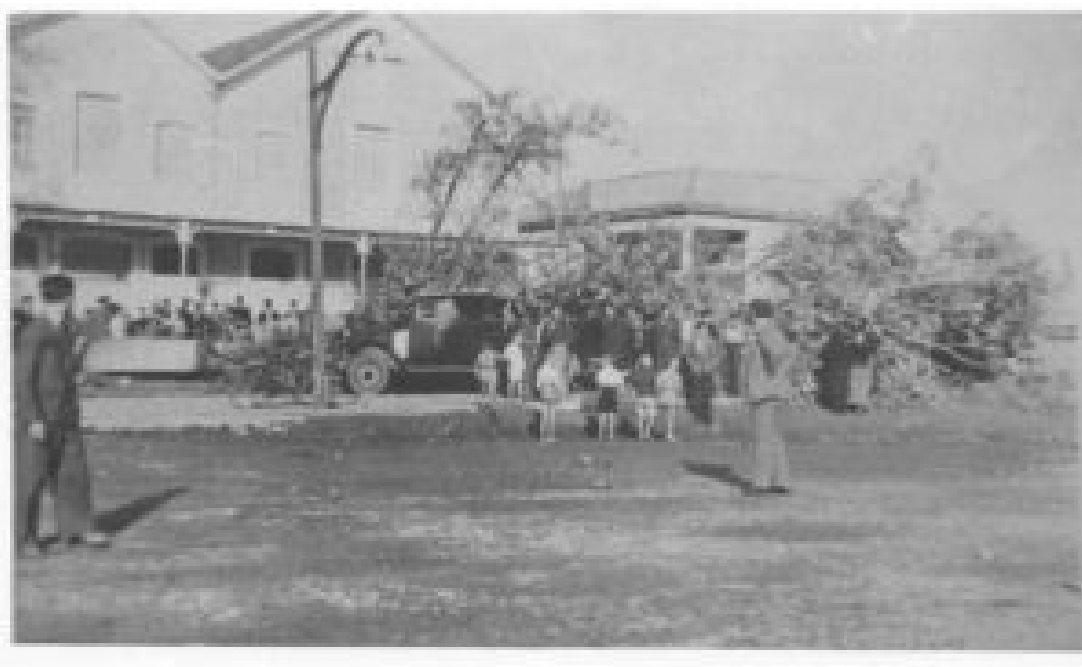
ΚΕΝΤΡΙΚΗ ΠΛΑΤΕΙΑ (ΠΡΩΗΝ ΠΛΑΤΕΙΑ ΖΑΝΗ)