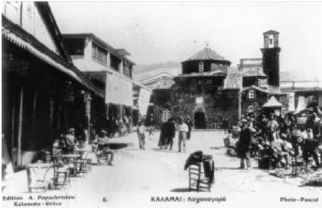
ΠΛΑΤΕΙΑ 23ης ΜΑΡΤΙΟΥ ΠΟΥ ΗΤΑΝ ΛΑΧΑΝΑΓΟΡΑ