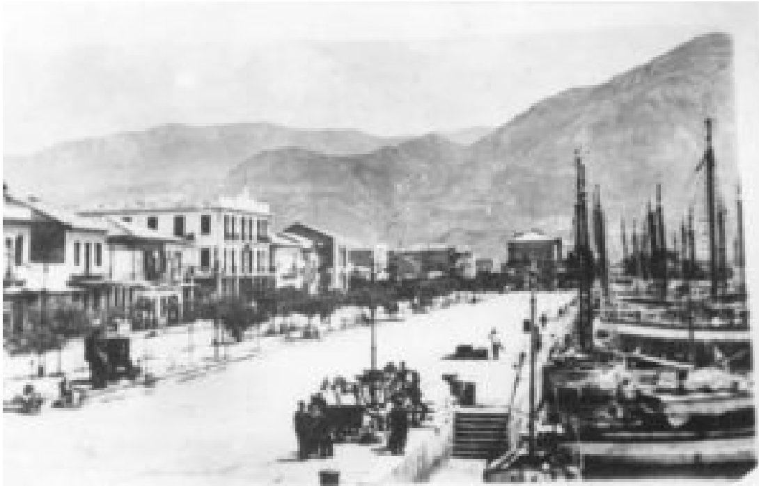
ΤΟ ΛΙΜΑΝΙ ΓΕΜΑΤΟ ΚΑΪΚΙΑ