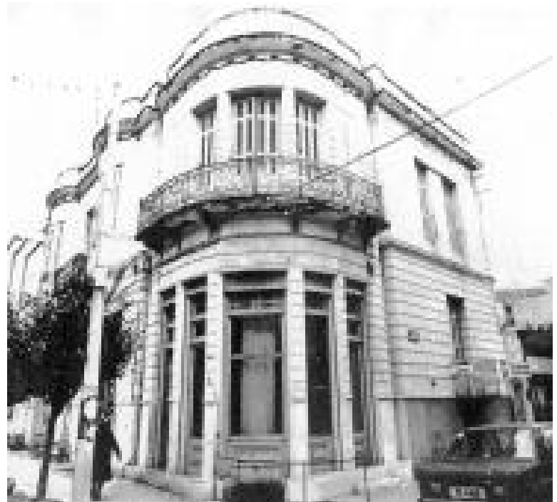
ΠΑΛΙΟ ΑΡΧΟΝΤΙΚΟ (ΣΙΔ.ΣΤΑΘΜΟΥ & ΑΝΤΩΝΟΠΟΥΛΟΥ)