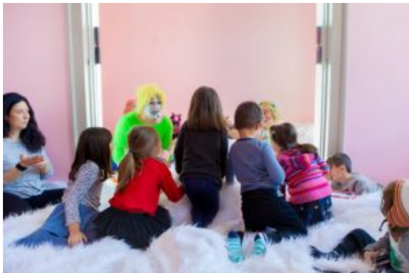
Drag queens (τραβεστί) επί τω έργω, δηλαδή τη μύηση μικρών παιδιών...

Μην αναρωτηθείτε ούτε πως δόθηκε η άδεια για ουσιαστικά την κακοποίηση παιδιών και την πρόκληση σύγχυσης σε μια ηλικία όπου συντελείται η αυτοέρευνα του φύλου και του ανθρώπινου σώματος, καθώς και η διαμόρφωση της σεξουαλικότητας. Στην Ελλάδα της “πρώτη φορά αριστερά” είμαστε όπου οτιδήποτε αντικοινωνικό και παρασιτικό αποθεώνεται και η οποιαδήποτε αξία και κανονικότητα θεωρείται καθυστέρηση και πολεμιέται.